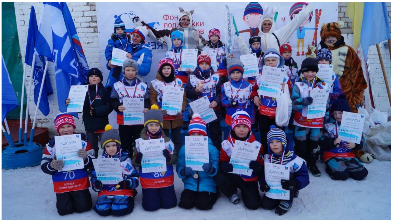
Бийский район с. Енисейское 5 марта 2023г.