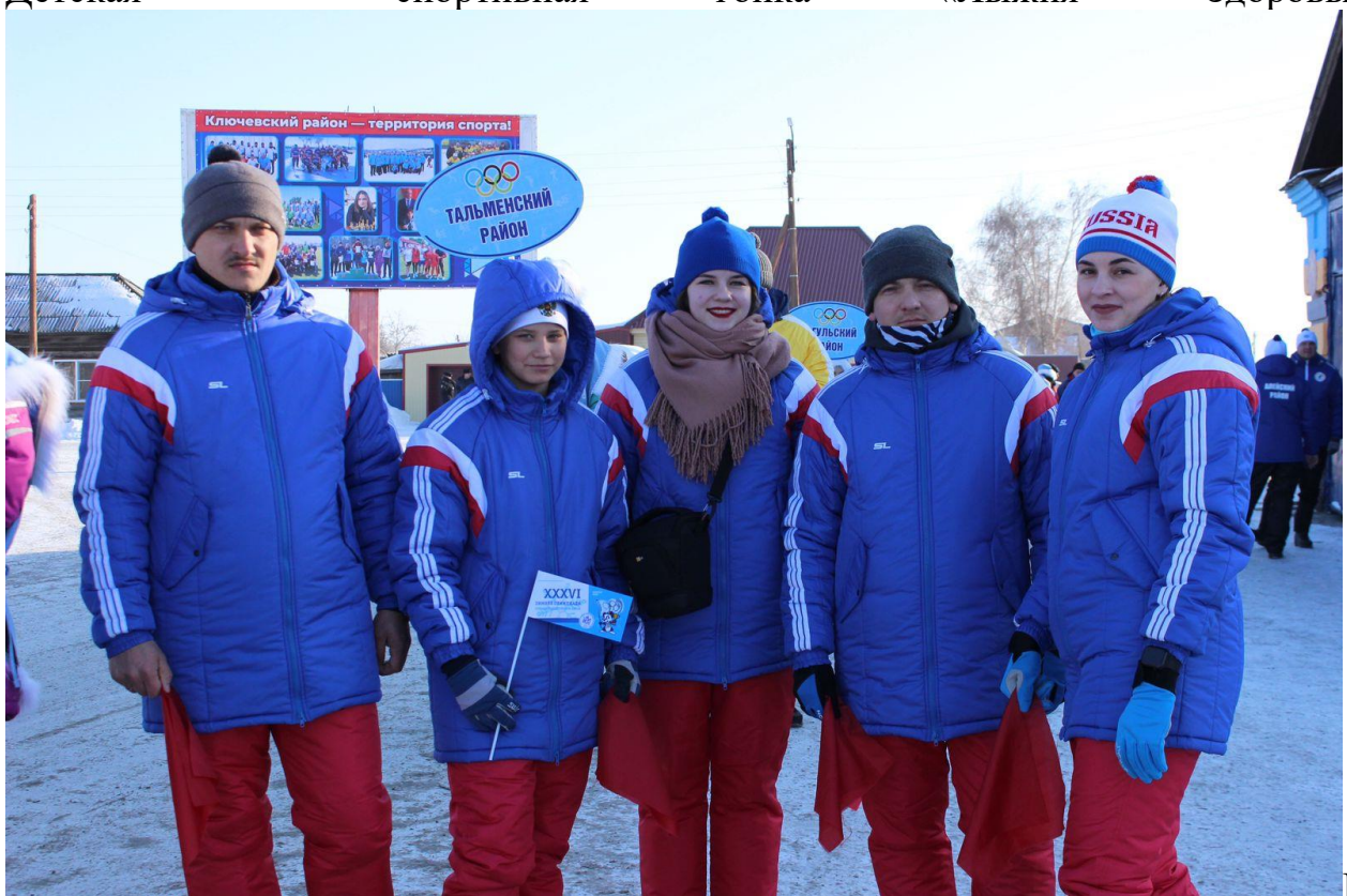
Ключевской район с. Ключи 2-5 февраля 2023 год.

По итогам 2023 года на территории Солтонского района активно ведется физкультурно – спортивная и массовая работа. Не смотря на снижение численности населения в районе, уровень спортивной работы по основным видам спорта, и охват ими населения практически не изменился. На территории