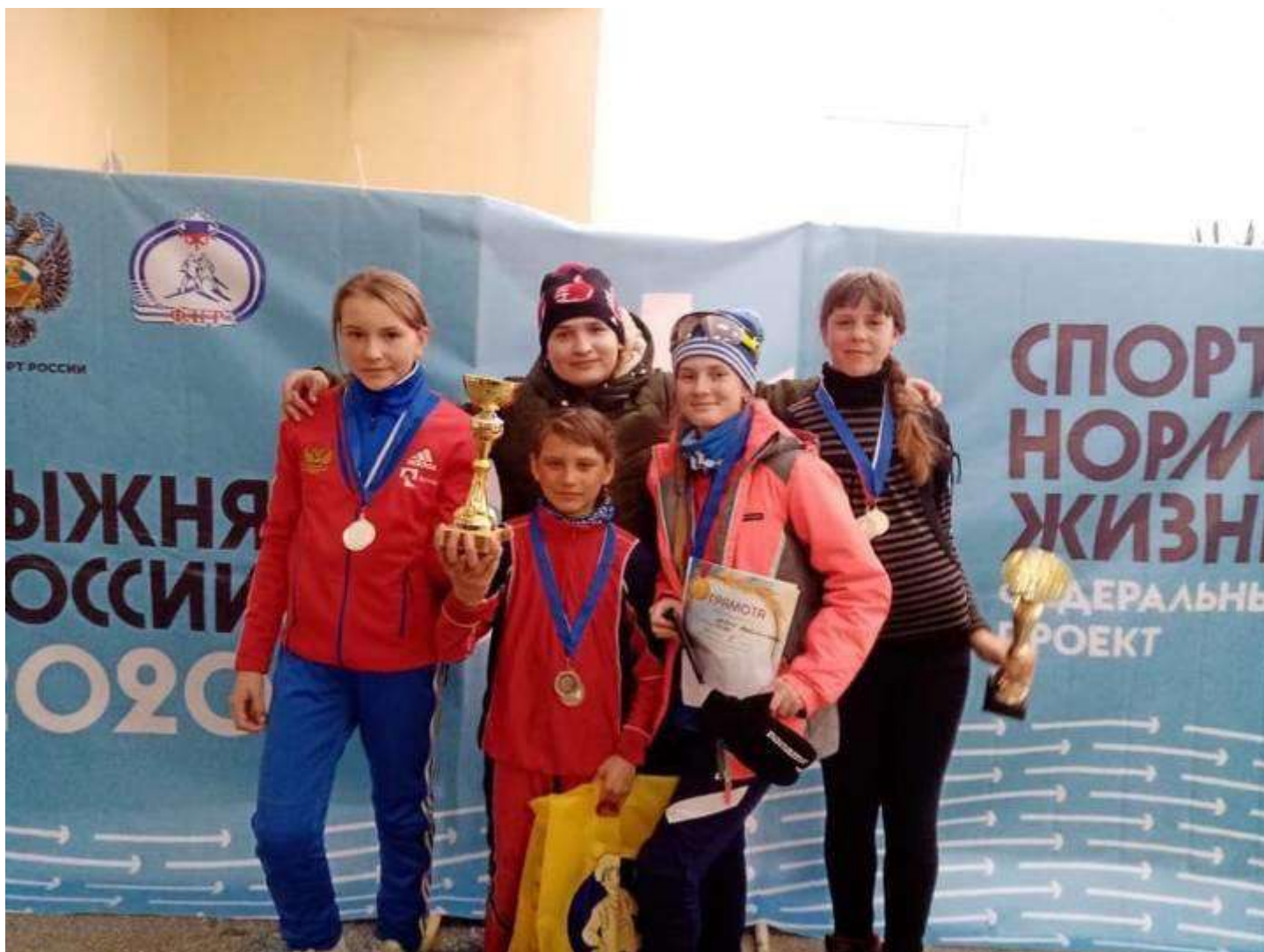
г. Барнаул. Всероссийская массовая гонка «Лыжня России»

По итогам 2020 года на территории Солтонского района активно ведется физкультурно – спортивная и массовая работа. Не смотря на снижение численности населения в районе, уровень спортивной работы по основным видам спорта, и охват ими населения практически не изменился. На территории Солтонского района на период 2020 года проживало 7 003 человек, из них 3274 активно занимаются физкультурно - спортивной и массовой работай, это почти 47,6% от всего населения.